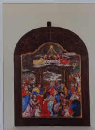
45. Ruzsa Ilona ikonfestő: Jézus születése